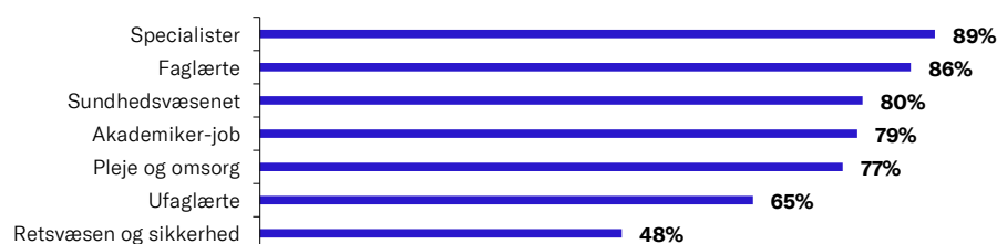
Figur 1: Er det okay at rekruttere udlændinge til disse jobs, hvis de ansættes lovligt og efter almindelige danske løn- og ansættelsesforhold?