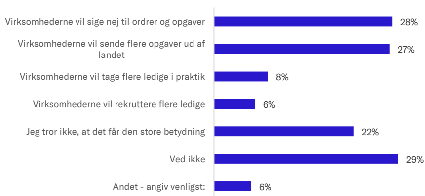
Figur 1: Hvad tror du det vil betyde for danske virksomheder, hvis der blev gennemført markante stramninger af regler om udenlandsk arbejdskraft?

Kilde: Dansk Erhvervs medlemsundersøgelse, januar 2018.