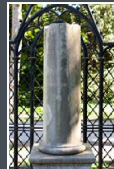
JORCKS FAMILIEGRAVSTED, ASSISTENS KIRKEGÅRD

Lejerne i dag omfatter butikker, gamle hæderskronede virksomheder som Kristeligt Dagblad og nystartede virksomheder som f.eks. spilfirmaer, der finder det attraktivt at bo i centrum af København.