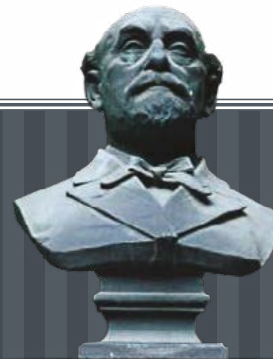
STIFTEREN AF FORMUEN